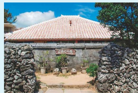
Data 沖縄県八重山郡竹富町小浜 (一般宅につき外観見学のみ)

ヒロイン・恵里が生まれ育った民宿としてロケが行われたこの家屋は、100年近く前に建てられたものだとか。琉球赤瓦やシーサーなど沖縄民家の伝統様式がそのまま残っており、国の登録有形文化財となっている。