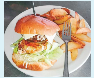
Data 沖縄県八重山郡竹富町 小浜3400-38 ☎0980-85-3970 11:00~23:00(火曜は11:00~17:00)

おなかを満たすなら地元の人気店へ行きたいもの。そこでランチには、こちらの名物「小浜バーガー」がオススメだ。小浜産の黒糖を使用したというテリヤキソースは、ここでしか味わえない。ボリュームとうまさはお墨付き！