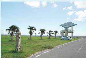
Data 沖縄県八重山郡竹富町小浜

ひときわ目立つ、マンタ（オニイトマキエイ）を模した展望台。実はこの付近の海はマンタが回遊することで知られており、ダイビングの人気スポットでもある。広い芝生にゴロンと寝転がって、小浜の自然が満喫しよう。