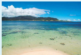
Data 沖縄県八重山郡竹富町小浜

細崎は、その名の通り細長く突き出た岬。岬の先端には遠浅の海岸が続き、マリブルーに染まった「南の楽園」といった風景を楽しめる。近くには漁師集落もあり、ありきたりな観光地では味わえない離島らしい雰囲気も。