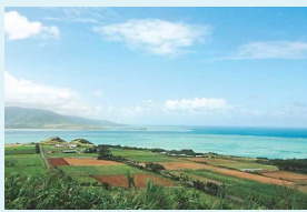
Data 沖縄県八重山郡竹富町小浜

こちらは海岸に群生するマングローブが一望できる展望台。マングローブが生い茂る眺めに、南国気分も急上昇！また、島随一の夕日スポットでもあり、夕暮れ時に訪ねれば、まったく異なる味わいの絶景が楽しめる。