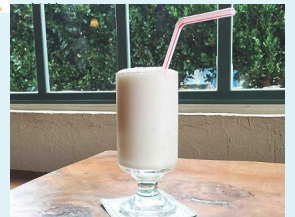
Data 沖縄県八重山郡竹富町小浜2584 ☎0980-85-3253 10:30~17:00 木曜・金曜休 ●竜宮神社

島巡りに疲れたら、甘い物で休憩はいかが？ こちらのカフェはお土産となる雑貨も置いてあり、ゆっくりくつろげる。素材が入手できた時にのみ販売される「島バナナジュース」は、バナナ好きな人ほど驚くおいしさ！