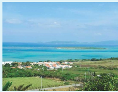
Data 沖縄県八重山郡竹富町小浜